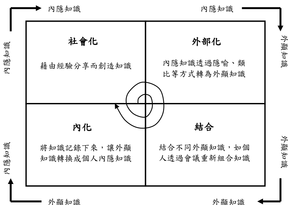
圖 1 知識螺旋