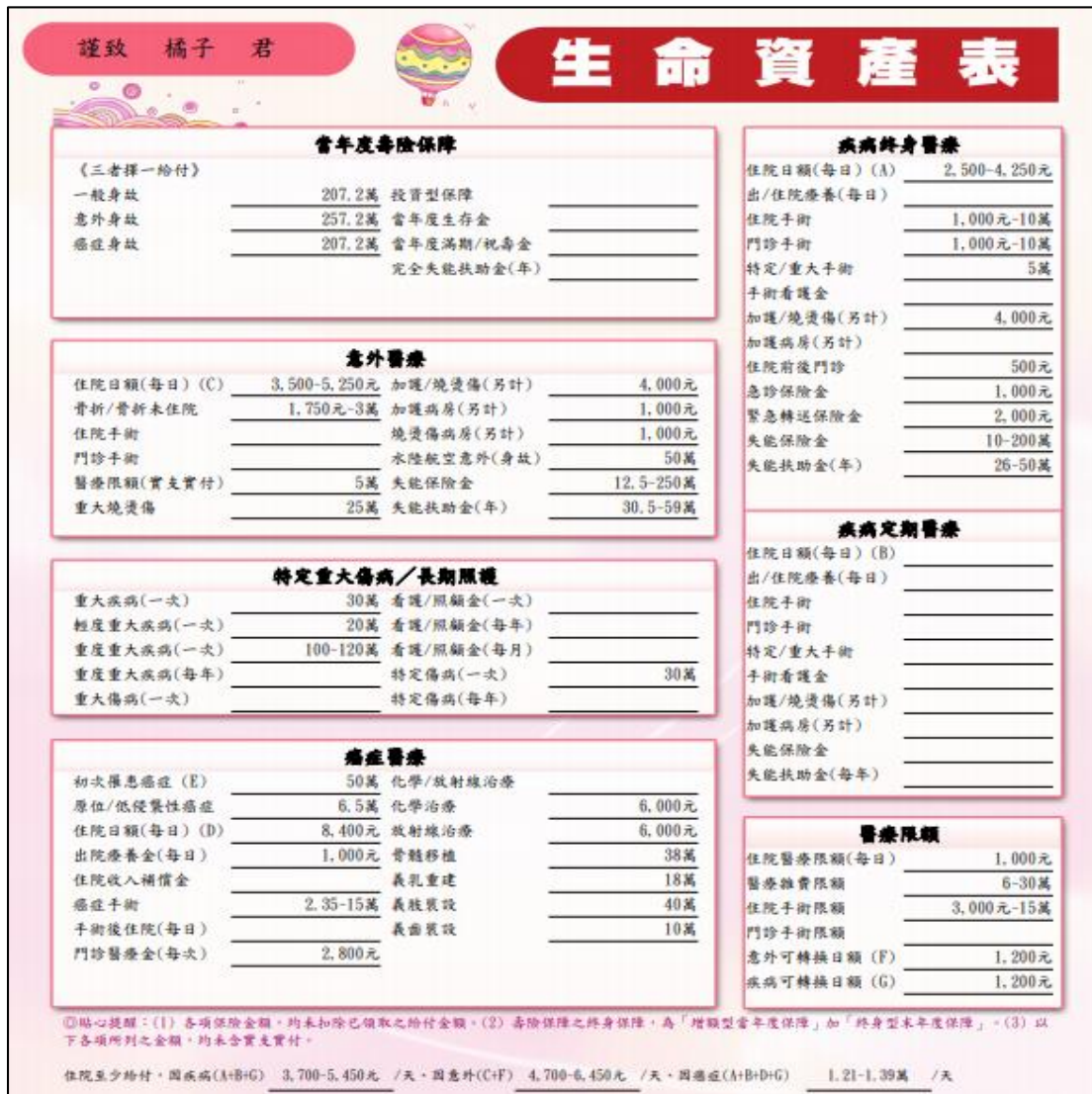
圖 10 橘子新增後生命資產表