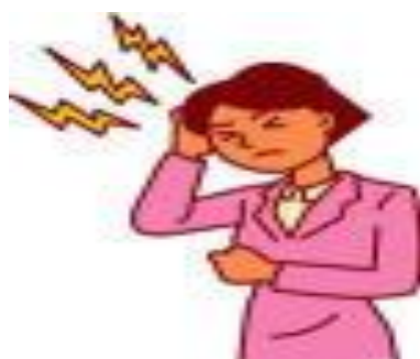
疼痛 (頭痛、後眼窩痛、骨骼關節或肌肉痛)