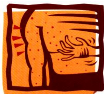
發燒 3-4 天，身上出現紅疹