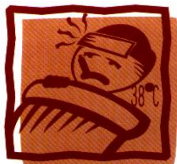
發燒到 38 度